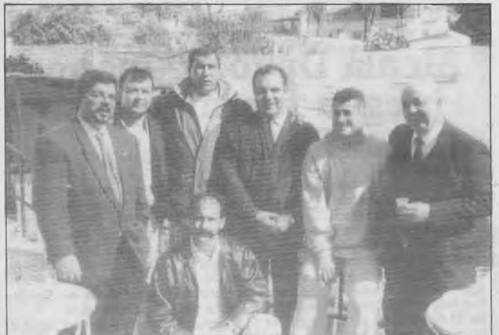
El conjunto alcalaense se vuelve a afianzar en casa con la victoria ante el Portacel -en la foto- y la del domingo, por lo que se nota de nuevo la alegría de los socios y seguidores del club.