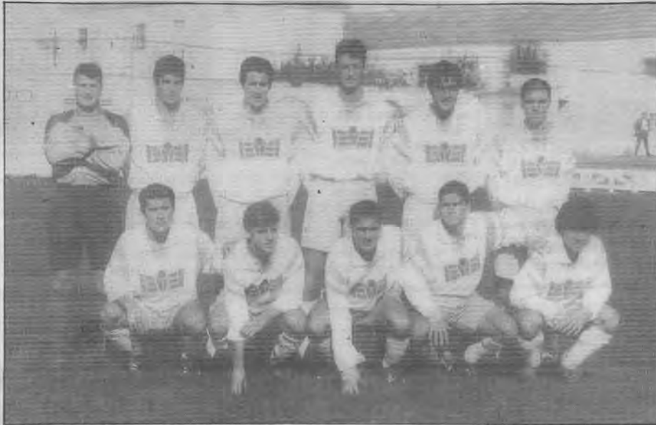
El C.D. Alcalá logró una victoria importante y sigue esperando su oportunidad en las tres últimas jornadas, que serán decisivas.

El C.D. Alcalá logró su tercera victoria consecutiva sin encajar un sólo gol y prosigue su escalada hacia las dos primeras posiciones.